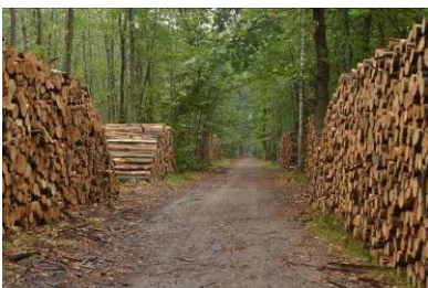
Le bois est entreposé en bordure de chemin avant d'être évacué