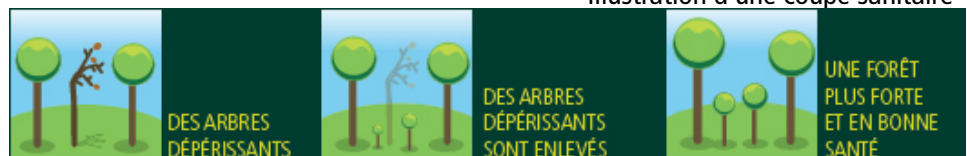
Illustration d'une coupe sanitaire

Cette coupe est programmée sur une surface de 3,7 hectares sur la parcelle 57a (parc forestier des Bruyères) et 8,48 hectares sur la parcelle 57b.